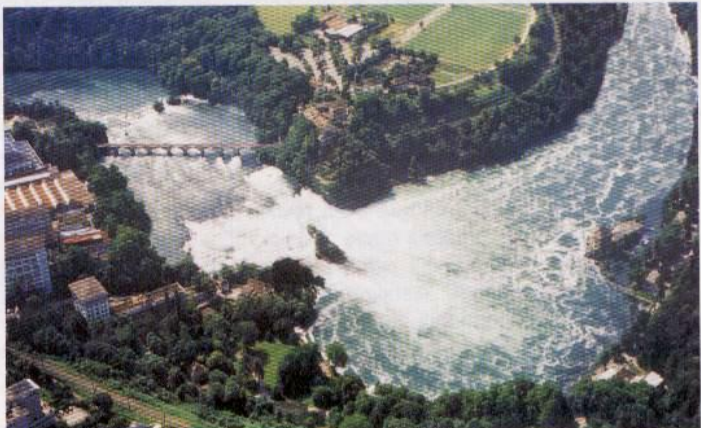
U jihoněmeckého města Schaffhausen jsou na řece Rýn krásné vodopády, zejména při pohledu z výšky vyniká síla protékající vody

je situace o poznání jiná, než v místě etapového startu. V aeroklubu jsou všichni přátelští a dostalo se nám i pozvání na klubovou oslavu. Stanujeme tři